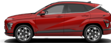
Ultimate Red Metallic