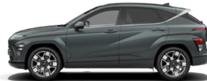
Cypress Green Pearl