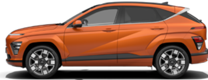
Jupiter Orange Metallic