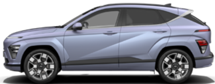
Meta Blue Pearl