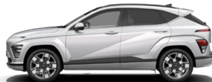
Shimmering Silver Metallic