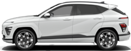
Serenity White Pearl