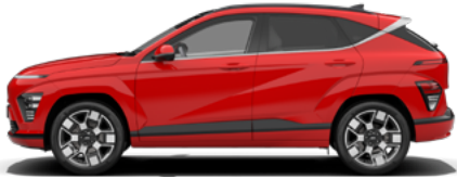
Engine Red Solid