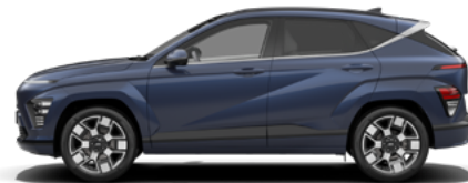
Sailing Blue Pearl