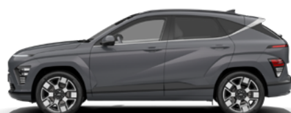
Ecotronic Gray Pearl