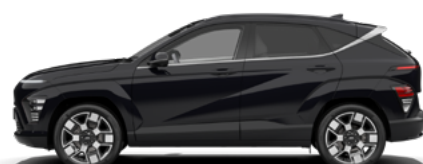
Abyss Black Pearl